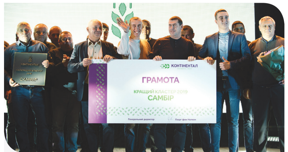
«Самбір» – кращий кластер Компанії за підсумками 2019 року