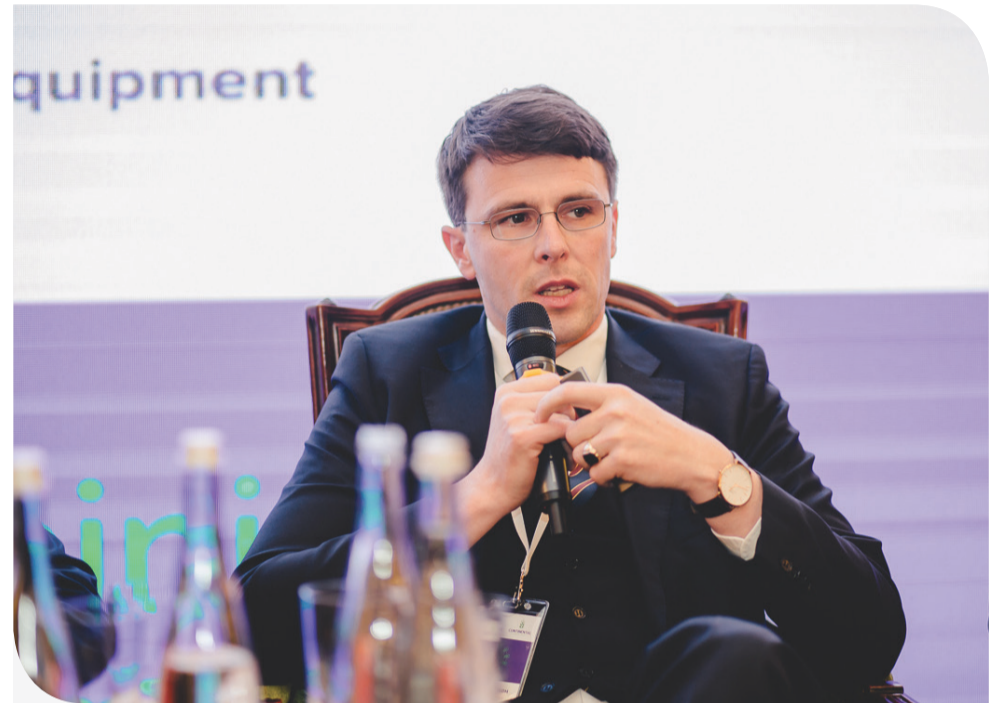
Георг фон Нолкен, Генеральний директор «Контінентал Фармерз Груп»

Багато важливих медичних, освітніх, інфраструктурних, культурних та спортивних програм вже були реалізовані з використанням цих коштів у п'яти регіонах Західної України, де працює «Контінентал». Значна підтримка була