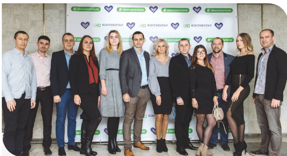
Управління ІТ Компанії «Контінентал»

На наступний рік «Контінентал» має ще більш амбітні плани. Серед стратегічних цілей Компанії – покращення виробничих показників та нарощення технічних потужностей. Агрохолдинг залишається надійним партнером для громад і продовжує роботу на розвиток держави.