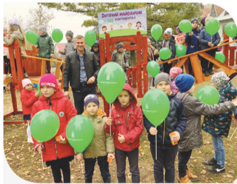
На відкритті дитячого майданчика в Подвірному

На святковому відкритті дитячого майданчика відбулось також частування, а для наймолодших ще й було проведено майстер-клас з аквагриму. Тож кожен з присутніх на святі, побачивши радість в очах дітей, отримав нагоду вкотре зрозуміти для себе, що це те, заради чого варто працювати та старатись зробити майбутнє кращим.