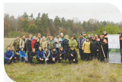
Кластер «Кам'янка-Бузька» висаджує липи

Новонасажені липові алеї не тільки прикрасять та озеленять території. Відчутне зростання кількості насаджень медодайних дерев, зокрема липи, уже за короткий період часу дозволить місцевим пасічникам збільшити свої медозбори, адже медодайні дерева становлять значну частину кормової бази бджільництва. У планах Компанії – продовжувати підтримувати пасічний рух, в тому числі – шляхом проведення подібних акцій, які б мали стати традиційними. Зокрема, продовжити «Марафон лип» планують вже навесні.