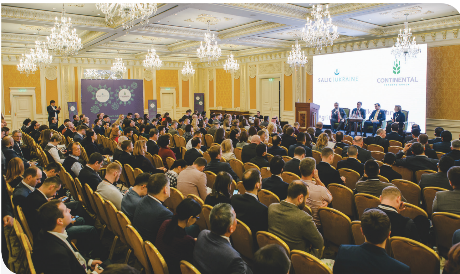
Учасники ІІ Саудівсько-Українського аграрного бізнес-інвестиційного форуму

Аграрний бізнес-інвестиційний форум вперше відбувся 22 листопада 2018 року в Києві. Це стало результатом двосторонньої угоди між Саудівською Аравією і Україною про співпрацю в сільському господарстві. Його коріння сягає у 2017 рік, коли був підписаний меморандум про співпрацю в області інвестицій в сільське господарство між Кабінетом Міністрів України та урядом Саудівської Аравії під час офіційного візиту Президента України в Ер-Ріяд.