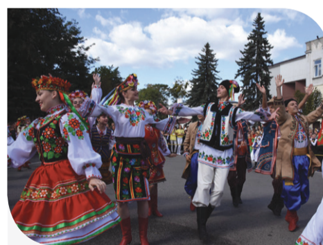
Звеселяли гостей фестивалю народні співи і танці

Дійсно, таке свято театру в Кам'янці-Бузькій організували вперше. Ініціативу навряд чи вдалося б втілити в життя, якби не фінансове сприяння спонсорів. «Корону Якуба» цього року допомогла організувати, в тому числі, й аграрна Компанія «Контінентал Фармерз Груп», яка обробляє на території Кам'янка-Бузького району чималу площу сільськогосподарських угідь. Аграрії надали на організацію свята 30 тисяч гривень благодійної допомоги. У Компанії переконані: такі фестивалі не лише гуртують людей, а й відроджують українські традиції.