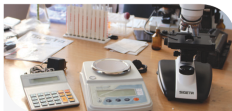
Нове обладнання для лікарні

Компанія «Контіненітал», яка раніше працювала на теренах Гусятинського району під назвою «МРІЯ», продовжує не тільки свою виробничу, а й соціальну діяльність. Допомогти Копичинецькій лікарні – їхній обов'язок, вважають аграрії. Адже пайовики компанії та жителі району звертаються за допомогою у медичний заклад, тому підтримка лікарні – це допомога кожному пацієнту; це створення належних умов отримання медичної допомоги; це піклування та вдячність за партнерство.