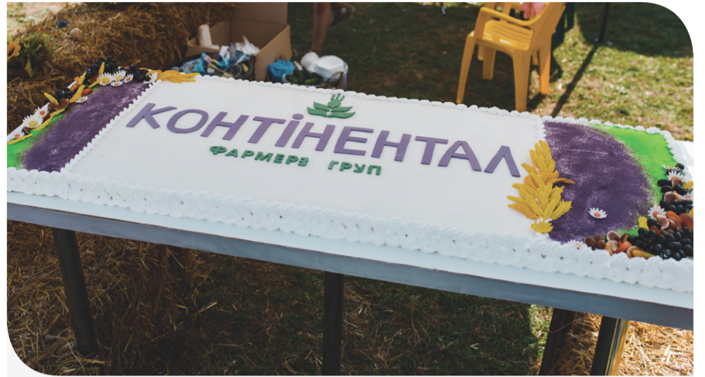
Святковий 100-кілограмовий ягідний торт

– Дуже гарно все зробили для дітей, є де їх розважити. Сподобалися народні колективи, які співають гарні українські пісні. І така атмосфера дійсно родинного свята тут, що весело на душі. Зараз буду куштувати ягідний пиріг, всі дуже на нього чекали, – прокоментувала пані Валентина.