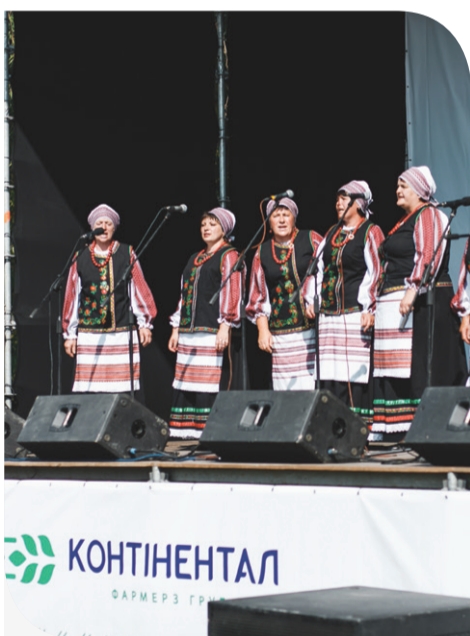
У святі взяли участь народні колективи

районі. Фестивальне дійство зібрало гостей із різних куточків Західної України. Кожен міг знайти розвагу до душі: безкоштовні частування, силові змагання, козацький куток, дитяча зона, ну і, звичайно, ярмарок.