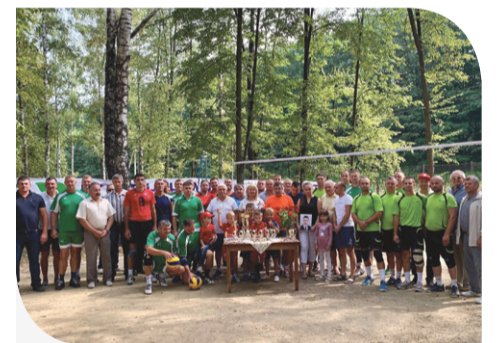
Учасники волейбольного турніру

До слова, Компанія «Контінентал» активно підтримує спортивний напрямок на територіях своєї присутності. Зокрема, у с. Іспас, де проходив волейбольний турнір, коштом аграріїв приміщення шкільного тирю облаштували штучним покриттям, а нещодавно ще й придбали спортивні мати та покривку, що дозволить приймати змагання міжнародного класу.