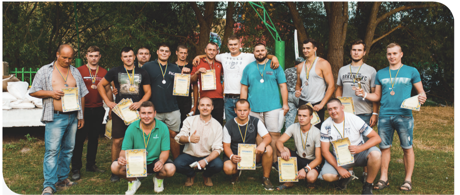
Учасники богатирських ігор

Не обійшлося на багатолюдному фестивальному дійстві без веселих співів та танців. На сцені фестивалю звучала пісня за пісню у виконанні аматорських колективів. Музичним подарунком для учасників свята став виступ гурту «Тріода», а також легендарних артистів із Поділля – братів Гжегожевських. Завершило святкування урочисте запалювання ватри та співанки, які ще довго лунали біля урочистого вогню.