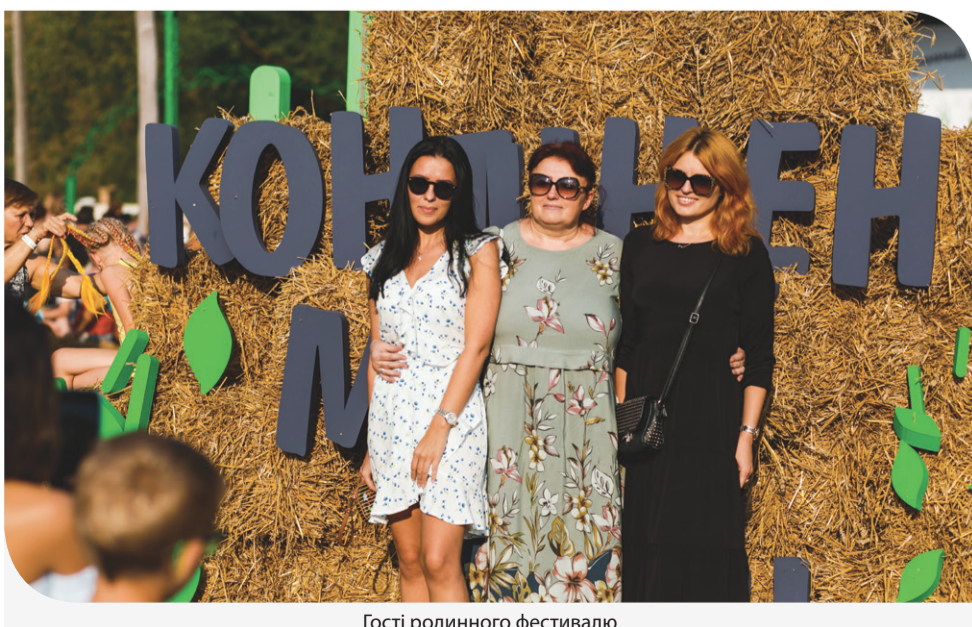
Гості родинного фестивалю

– Цей фестиваль створений для того, щоб популяризувати кооперативи та їх продукцію. Показати, що в Україні можна і потрібно розвивати села, створюючи й підтримуючи місцевий бізнес. Кооперативний рух – це той інструмент, в якому ми бачимо великий економічний потенціал для українського села. Саме тому «Контінентал» пропонує створення кооперативів на території своєї присутності і всіляко сприяє активним громадам, які хочуть об'єднатися заради спільної справи. Ми фінансово підтримуємо їх діяльність і допомагаємо з навчанням, обміном досвідом, розширенням і розвитком. Тому сьогодні маємо нагоду в черговий раз показати: ми готові допомагати та підтримувати! – зазначив Генеральний директор «Контінентал».