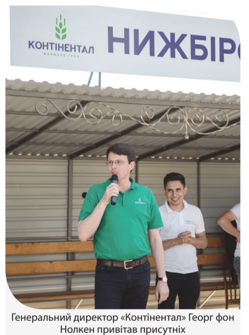
Генеральний директор «Контінентал» Георг фон Нолкен привітав присутніх

– Перш за все, я дуже радий, що працівники підтримують дух корпоративного волонтерства. Наголошу, що однією з цінностей нашої Компанії є турбота, а це означає високий рівень соціальної відповідальності, яка лежить на нас. Ми раді, що пайовики довіряють нам. А ми, у свою чергу, можемо втілювати проекти із покращення інфраструктури. Ми хочемо більше контактувати з нашими громадами, в яких працюємо, та прагнемо бути для них надійним партнером. Я дякую за співпрацю та дозвіл брати участь у громадському житті села. Ми завжди сподіваємось, що зможемо зробити щось вагоме та стати на крок ближче до своїх пайовиків. Думаю, що це лише маленька частина того, що «Контінентал Фармерз Груп» зробить для розвитку громад.