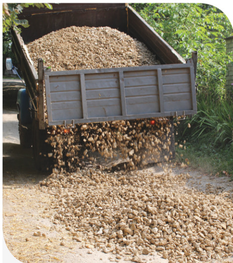
200 тонн щебню та 300 тонн відсіву закупила Компанія «Континентал»

Більша частина центральної дороги села Залісці, що на Збаражчині, у відмінному стані. Ще декілька років назад у селі проклали асфальт, тому близько 9 км шляху – без ям та вибоїн. Веде дорога у центр села, тут ФАП, сільська рада, школа та магазин. Як то кажуть, саме тут вирує життя селян. Звідси веде дорога у іншу частину Залісців, та тут – бездоріжжя. Асфальту тут ніхто не прокладав, та й з часів колгоспу, зізнаються місцеві, капітального ремонту не було. Компанія «Континентал», яка орендує землі у селі, вирішила допомогти у вирішенні наболілої проблеми селян. Тому ще на початку літа почали завозити щебін та відсів для покращення стану доріг у населеному пункті.