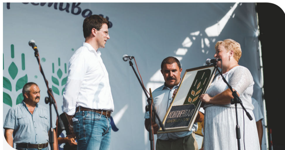
Генеральний директор «Контінентал» Георг фон Нолкен приймає подарунок від Купинської громади

Організує родинне свято уже втретє задля популяризації кооперативного руху Компанія «Контінентал Фармерз Груп». Вона підтримала уже три десятки сільськогосподарських обслуговуючих кооперативів, які забезпечують додатковим заробітком близько 2 тисяч селян. Щоб поділитись успіхом і показати усім охочим результати роботи кооперативних об'єднань, організували ярмарок кооперативів: були тут і буковинський кооператив «Добрі газди» з різноманітними сирами, і пасічний кооператив «Бджолиний край» із Тернопільщини зі своєю медовою продукцією. Крім того, на святі були представники з інших кооперативів: «Солобоковецький бджоляр» (Хмельницька область), «Ягідний рай» (Хмельницька область), «Медовий фільварок» (Тернопільська область), «Ягідний лан Шумщини» (Тернопільська область), «Людвиганська перлина» (Тернопільська область).