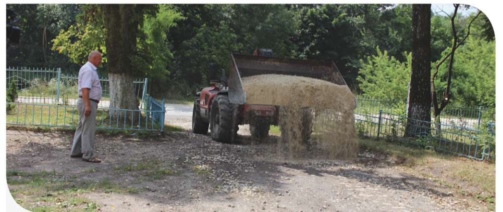
Підсипали дороги в селі спільними силами

Працює агрохолдинг у селі майже 10 років. Ремонт дороги – не єдина допомога громаді села. Майже кожного року Компанія, підтверджуючи свою соціальну відповідальність, допомагає вирішувати проблеми населеного пункту.