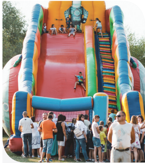
Діти забавлялись досхочу на атракціонах

Пані Валентині з Городоцького району теж дісталася порція ласощів. На свято вона завітала зі своєю сім'єю. Гостя фестивалю зізнається: таке масштабне свято тут організували вперше, тож радо поділилася враженнями.