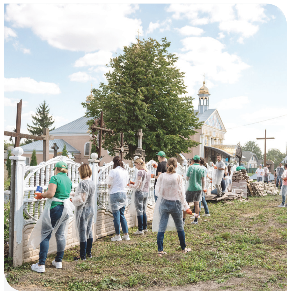
«Контіненталівці» швидко навели лад навколо церкви

До проведення толоки долучився і особисто Генеральний директор