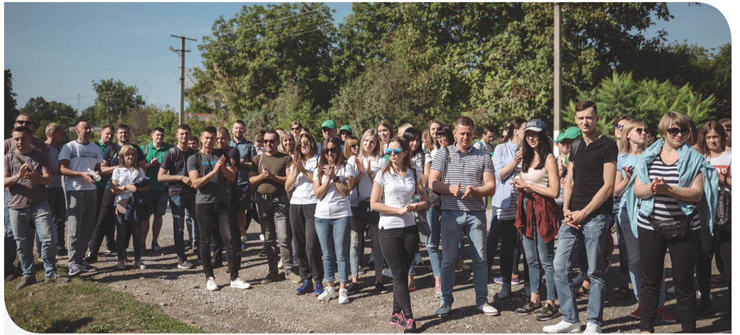
Співробітники «Контінентал» прибули у Нижбірок великим дружнім колективом

У вересні працівники Компанії «Контінентал Фармерз Груп» у рамках своєї програми корпоративного волонтерства завітали до села Нижбірок Васильковецької об'єднаної територіальної громади (Гусятинський район, Тернопільщина) для впорядкування території церкви Пресвятої Трійці, амбулаторії, а також облагородження кладовища. Участь у заході взяли понад 150 офісних працівників. Подібну толоку Компанія уже успішно проводила минулого року, тоді в містечку Гусятин співробітники «Контіненталу» допомогли місцевому стадіону буквально «переродитися» за півдня. Натхненні торішніми результатами, «контіненталівці» знову приїхали допомагати пайовикам Компанії наводити лад та красу у їхніх населених пунктах.