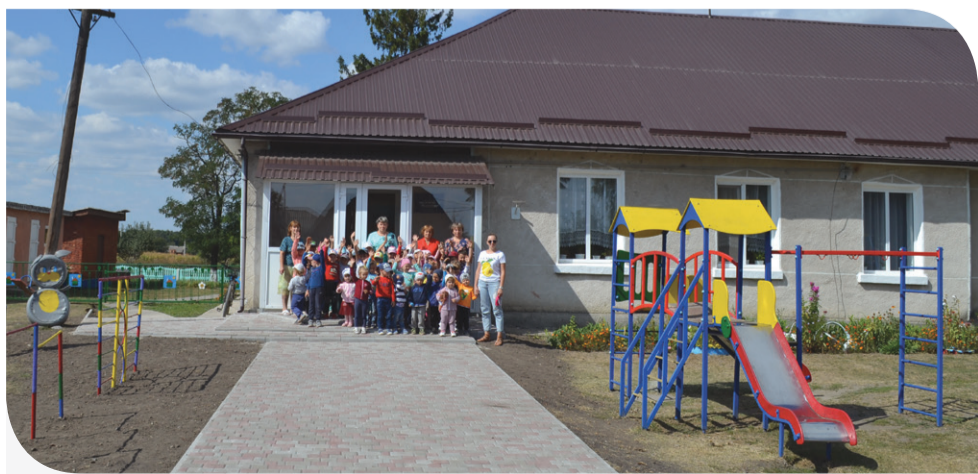
На оновленому подвір'ї Грузевицького дитсадка