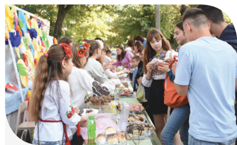
На «Короні Якуба» весело ярмаркували