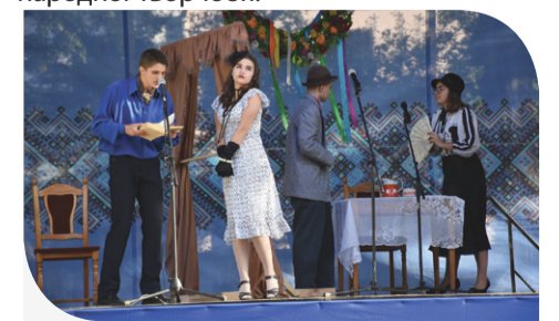
Свято театру не обійшлося без театральних вистав

Театральне свято «Корона Якуба» вдалося на славу. З наступного року фестиваль планують зробити традиційним. Містяни вірять, що започаткована ними справа – це вагомий вклад у збереження та розвиток культури, традиції українського театру та народної творчості.