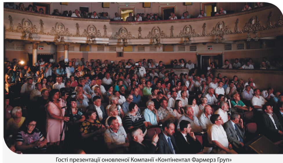
Гості презентації оновленої Компанії «Контінентал Фармерз Груп»

Тернополі. А представництва «Контіненталу» працюватимуть в Києві і Вирові (Львівська область). Присутність такого потужного агрохолдингу є важливим фактором для економічного клімату західноукраїнського регіону, вважають представники місцевої влади та висловлюють сподівання, що ефективна співпраця нової Компанії із громадами на місцях продовжиться.