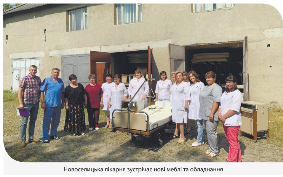
Новоселицька лікарня зустрічає нові меблі та обладнання