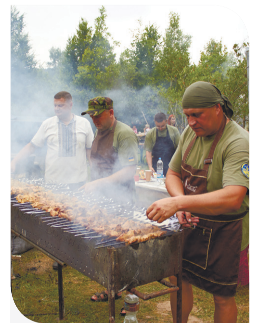
Смачні частування – невід'ємний елемент народних гулянь

вдалого свята, а підтримка від «Контінентал Фармерз Груп» – запорукою благополуччя місцевих громад і надійною опорою для розвитку культури й сприянню народним традиціям.