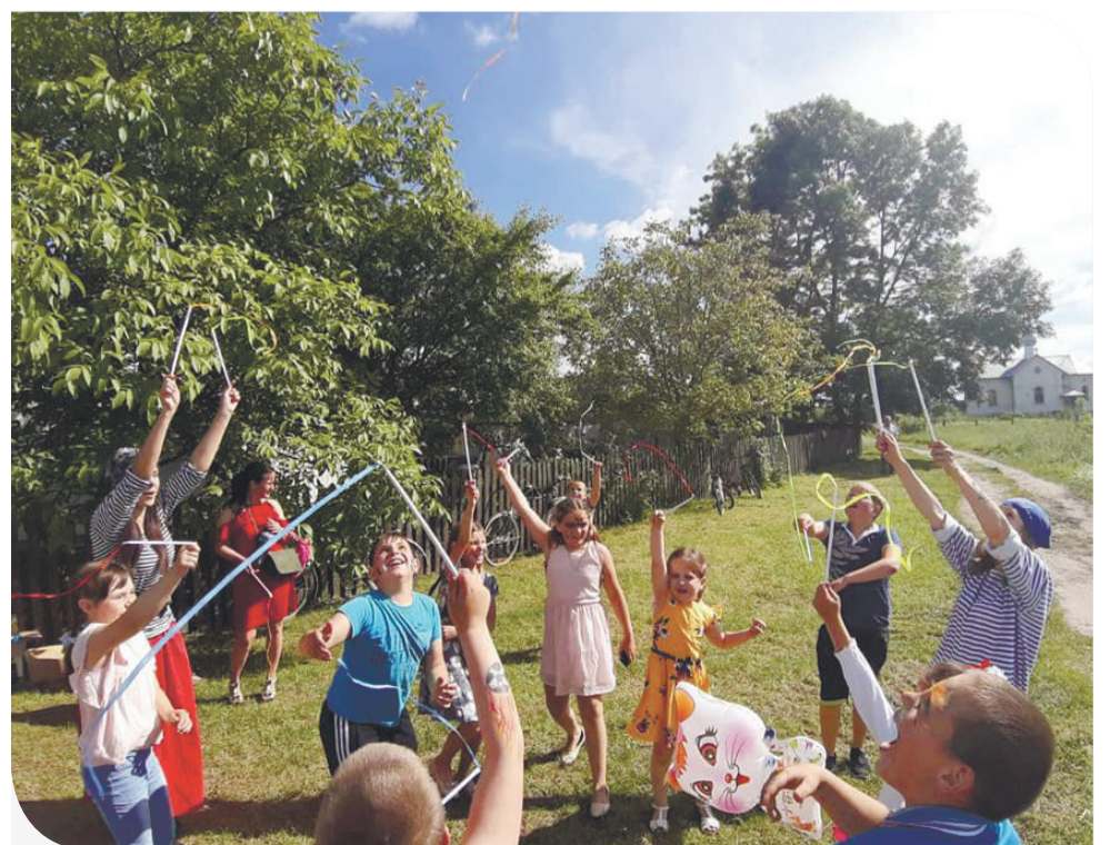
Літня пора для дітей села Стремінь – час ігор та розваг