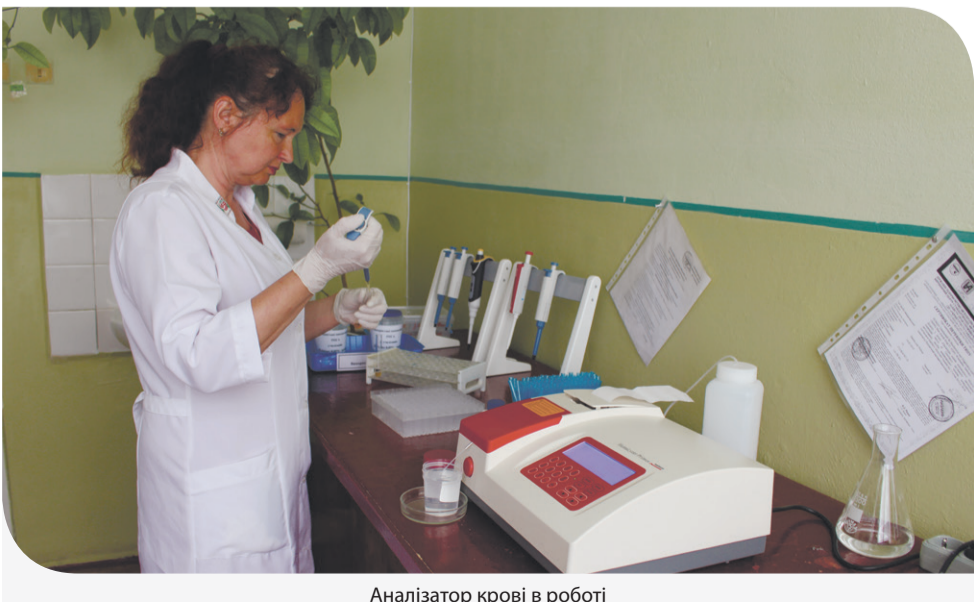
Аналізатор крові в роботі

– Я рада, що ми маємо можливість працювати на сучасній техніці. Цей апарат дозволяє отримати більш точні результати дослідження. До того ж, він