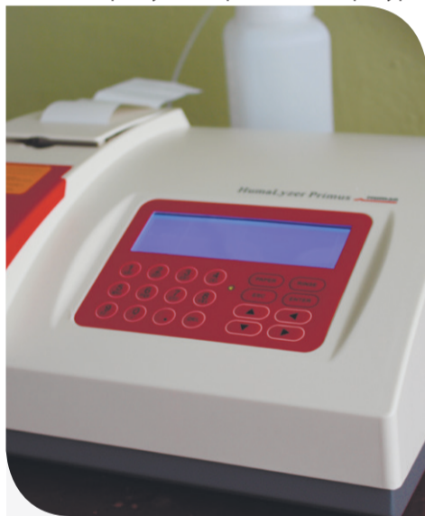
Новопридбаний аналізатор крові