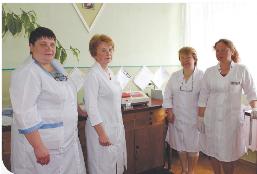
Колектив лабораторії Збаразької ЦРЛ