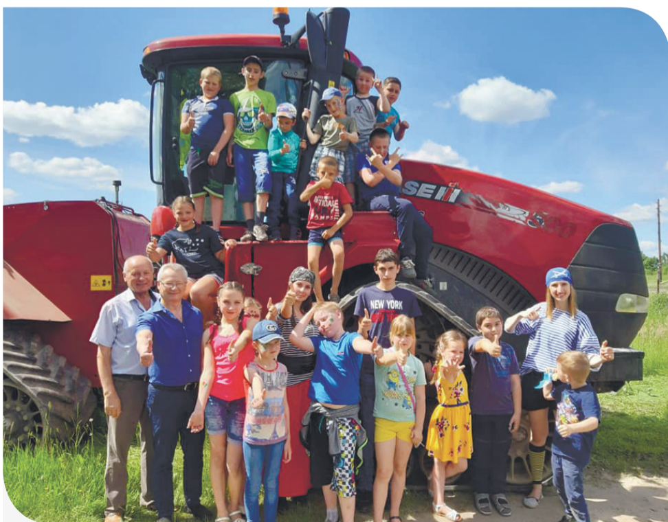
Потужний трактор з технопарку «Контіненталу» – найкраща фотозона для малечі

На «Братині» ярмаркують, частуються і забавляються як гості, так і учасники. Але головною родзинкою народного гуляння завжди залишається музичне