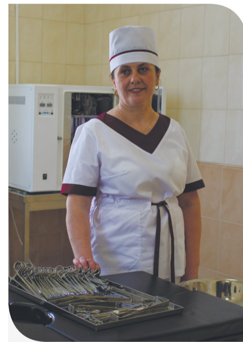
Медсестра на робочому місці

для реалізації соціальних ініціатив. Лише у 2018 році для району було спрямовано 1,8 млн грн на розв'язання проблем у культурі, спорті, освіті, медицині, духовності, інфраструктурі. Загалом для втілення соціальних проектів в області своєї присутності об'єднана компанія торік виділила понад 34 млн грн.