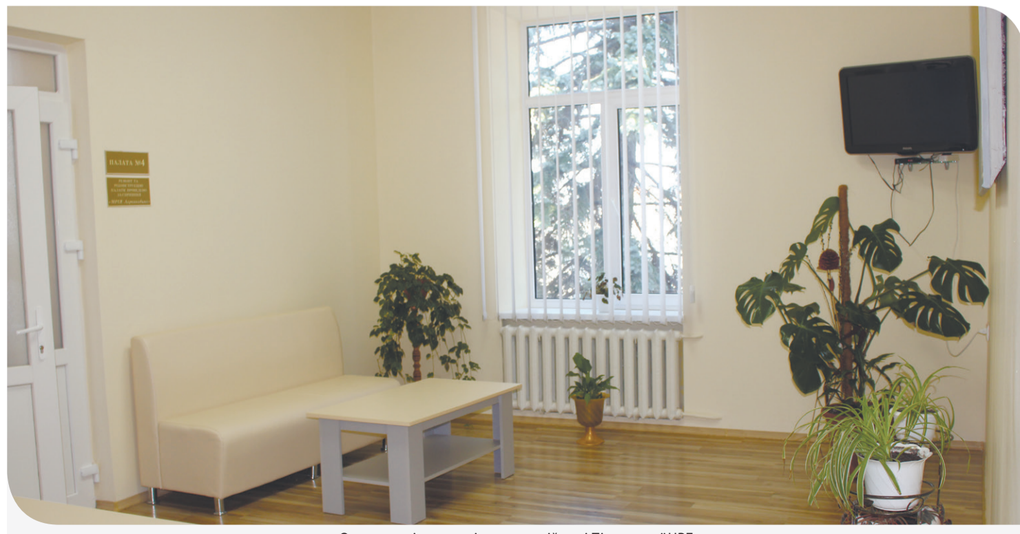
Оновлена кімната у відпочинковій зоні Підгаєцької ЦРЛ

«Контінентал» докладає усіх зусиль, аби співпраця з пайовиками була якнайбільш продуктивною для громад. У минулому році об'єднана Компанія на території 5-ти областей своєї присутності сплатила понад 34 млн грн на розвиток інфраструктури, медицини, освіти та культури, на допомогу бійцям на Сході держави та інші соціальні потреби громад. Ця сума утворена за принципом формування соціального бюджету розміром 130 грн з кожного гектара землі в обробітку Компанії. Таким чином, чим більше земель громада віддає в обробітку «Контіненталу», тим відчутнішу фінансову підтримку отримує від Компанії на втілення своїх соціальних проектів.