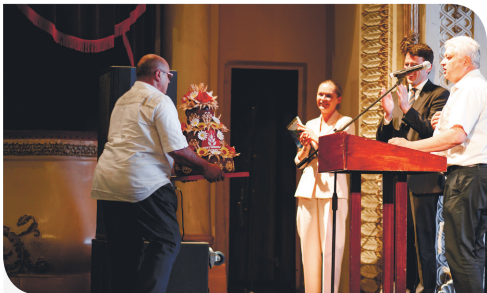
Коровай для «Контіненталу» привезли гості з Хмельницьчини