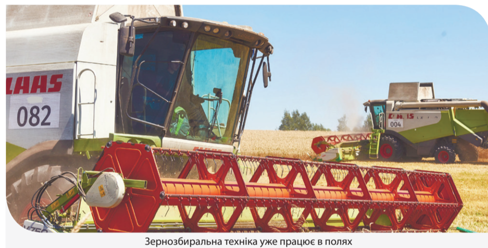
Зернозбиральна техніка уже працює в полях

У поточному сезоні в агрохолдингу планують зібрати врожай озимого ячменю із площі 20,6 тис. га, озимого ріпаку – з 28,3 тис. га, озимої та ярої пшениці – відповідно, 46,6 і 7 тис. га, а також 400 га озимого жита.