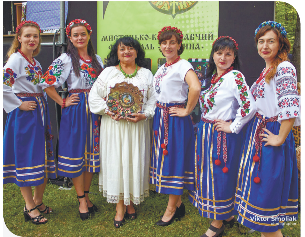
Мистецько-краєзнавчий фестиваль «Братина-2019» зустрів гостей барвисто

Але не тільки Тернопільщина вміє святкувати та веселитися. На Львівщині агрохолдинг «Контінентал Фармерз Груп» теж нещодавно влаштував свято – для дітей села Стремінь Сокальського району. Організація таких заходів, приурочених найменшим мешканцям населених пунктів, де працює Компанія, стала вже доброю традицією. Особливо актуальними подібні свята стають під