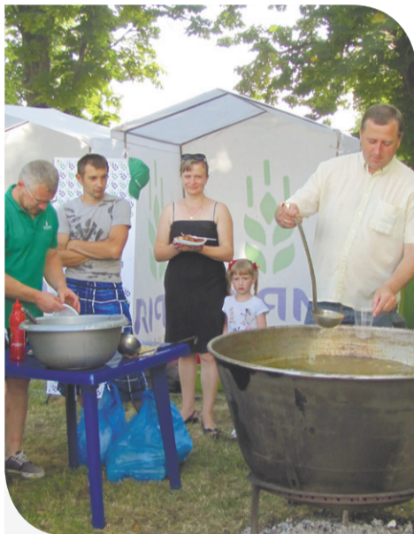
На фестивалі зеленого борщу в Підволочиську

дітями, а відвідують фестиваль цілими родинами, адже він має чим зацікавити кожного – від малого до старого. Народні майстри демонструють свої ремесла, творчі колективи – танці та пісні, а всі охочі – старовинні етнічні костюми.