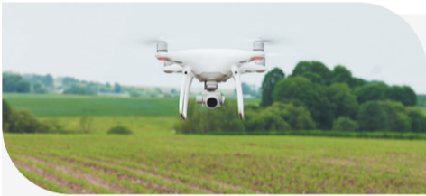
Моніторинг полів проводиться квадрокоптерами