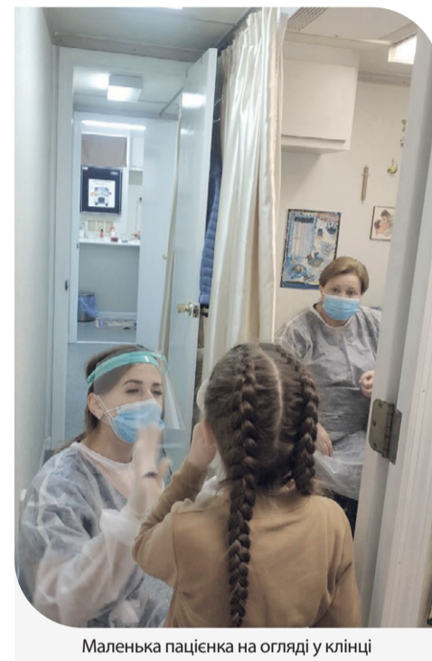
Маленька пацієнтка на огляді у клініці