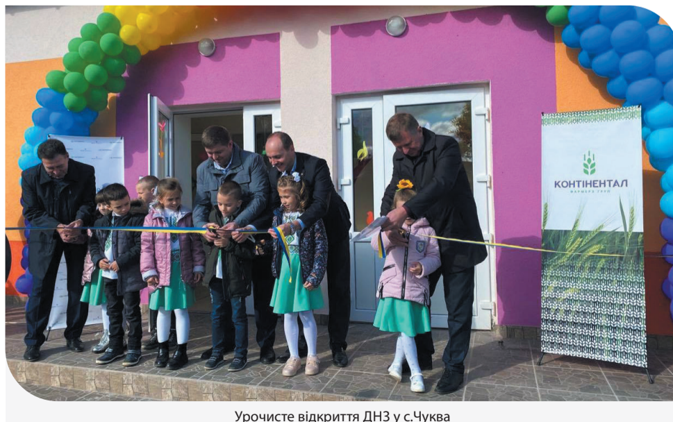
Урочисте відкриття ДНЗ у с. Чуква