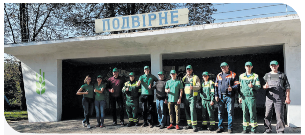
Оновлена зупинка завдяки старанням працівників кластеру «Буковина»

У межах проекту уже другий рік поспіль покращують інфраструктуру на Самбірщині. Цьогоріч капітально вдалось змінити вигляд автобусних зупинок у селах Острів, Нижнє та Купновичі. Раніше – руїни, тепер –