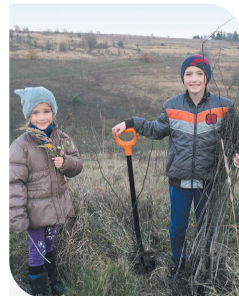
Помічники екологічної акції на кластері «Карпати»

Інтерактивна карта медодайних культур доступна за посиланням https://honey.cfg.com.ua/ .