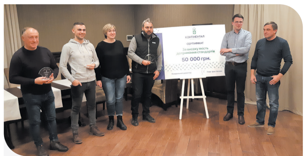
Нагородження найкращих кластерів за результатами об'їзду

За результатами об'їздів визначили найкращий кластер, який отримав відзнаку «За високу якість дотримання стандартів». Здобув перемогу кластер «Тернопіль», друге місце – кластер «Поділля» і третє – «Полісся». За словами керівника кластера-переможця, до оцінювання роботи старанно готувалися. Але старалися не заради нагороди, а щоб вдосконалити роботу команди.