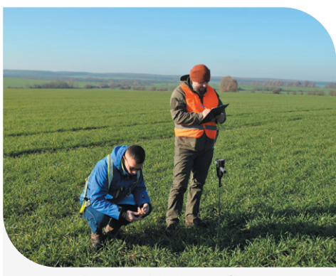
Оцінка посівів під час об'їзду