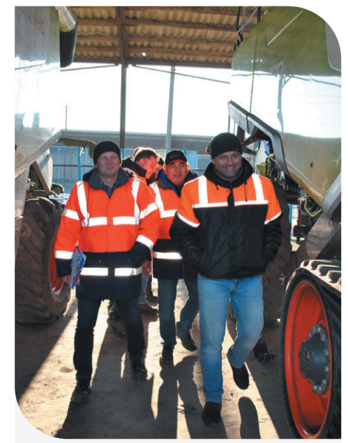
Огляд техніки учасниками заходу

В Компанії переконані, що отриманий досвід допоможе команді «Контінентал» стати ще ефективнішою у новому виробничому сезоні, а такі об'їзди стануть традиційними.