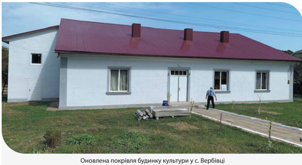
Оновлена покрівля будинку культури у с. Вербівці

Компанія «Контінентал Фармерз Груп» активно допомагає громадам, тому з початку 2020 року на реалізацію соціальних проектів на території Чернівецької області було спрямовано 2,3 млн грн. У тому числі, понад 768 тис. грн з них – у Заставнівському районі.