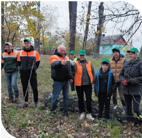
Працівники кластеру «Кам'янка-Бузька» під час робіт у с. Полове

Соціальний проект «Корпоративне волонтерство» уже кілька років поспіль успішно реалізують працівники Компанії спільно із жителями населених пунктів, де «Континентал» обробляє землі. В рамках ініціативи співробітники агрохолдингу покращують інфраструктурні об'єкти у громадах та допомагають із благоустроєм. «Континентал» прагне стати зразком для наслідування місцевим жителям та бізнесу, адже соціальна відповідальність – це рушій доброти та позитивних змін.