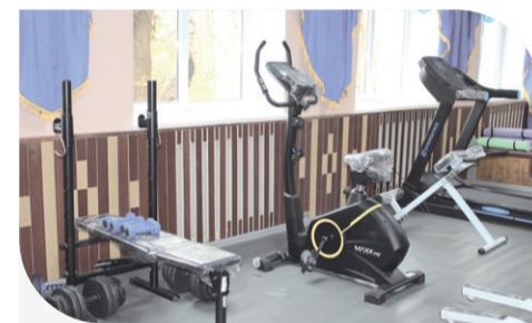
Тренажерний зал у с. Людвище

Компанія обробляє 920 га землі у населеному пункті, чимало жителів села працюють на базі агрохолдингу, крім того, Людвище особливе тим, що тут організований молочний кооператив «Людвищанська перлина», який підтримує «Контінентал».