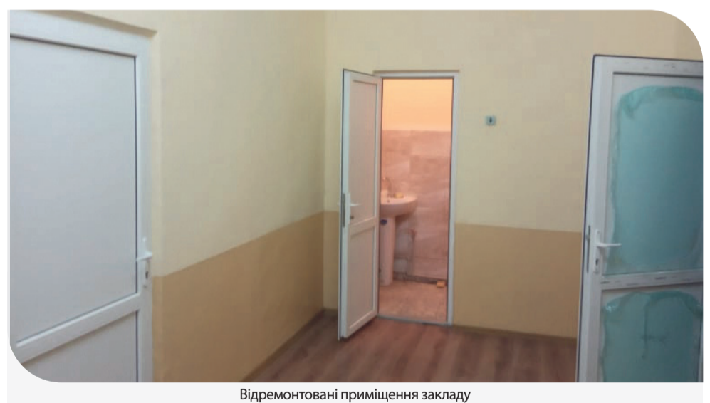
Відремонтовані приміщення закладу

Карантином тут скористались із користю – провели ремонт та, головне, облаштували санвузол. Такі оновлення вдалось реалізувати завдяки співпраці з Компанією «Контінентал Фармерз Груп», яка фінансувала ремонтні роботи.