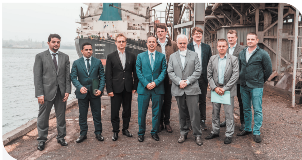
Посол Саудівської Аравії в Україні, представники компанії SALIC та керівництво "Контінентал Фармерз Груп" у порту Чорноморська під час експортної відправки зерна

У «Контінентал Фармерз Груп» також зазначають, що компанія SAGO, яка виконує державні закупівлі для Королівства Саудівська Аравія, висуває дуже високі вимоги до якості зерна. Це вважається важливим кроком у розвитку «Контінентал Фармерз Груп», досягненні її стратегічних цілей, а також початком міцної міжнародної співпраці.