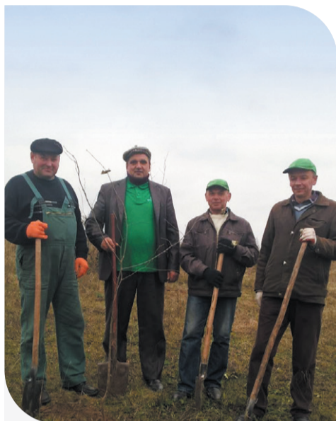
Висадка медодайних дерев на кластері «Полісся»

Одним із пріоритетних напрямків соціальних інвестицій «Контінентал Фармерз Груп» є благоустрій територій громад, у яких присутня Компанія.