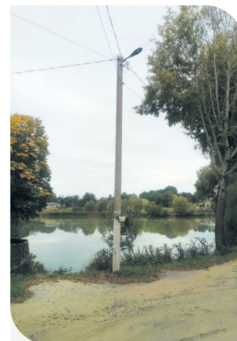
Вуличне освітлення у с. Чепелівка

«Контінентал» підтримує громаду Чепелівки впродовж всього часу, відколи орендує тут землі. В минулі роки соціальну допомогу спрямували на заміну вікон у школі та на асфальт для ремонту дороги. Місцеві жителі щиро вдячні Компанії за своєчасну допомогу.