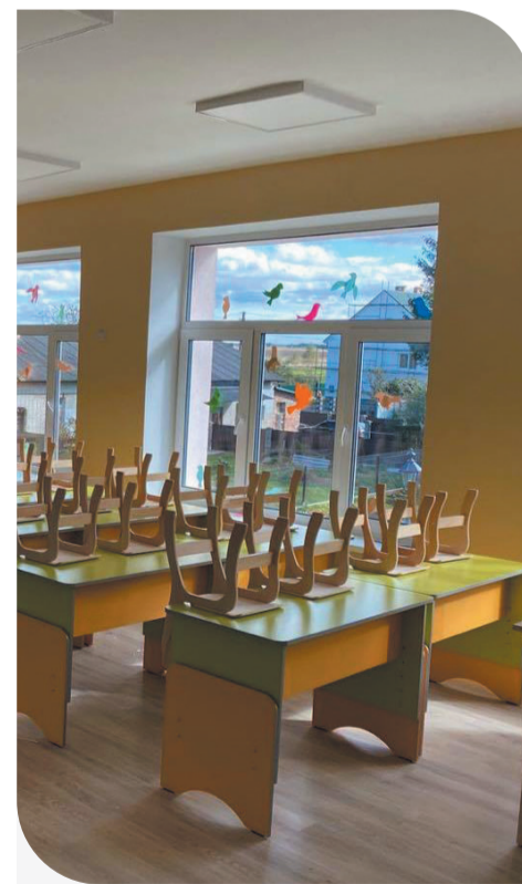
Відремонтовані кімнати ДНЗ у с. Чуква чекають вихованців

До слова, спортивний майданчик зі штучним покриттям в Чукві побудований в межах реалізації Комплексної програми розвитку фізичної культури та спорту Львівщини на період до 2021 року. З обласного бюджету на його будівництво виділили 700 тис. грн, з місцевого бюджету ще 120 тис. грн. Вагомим внеском стали також кошти, виділені «Контінентал Фармерз Груп».