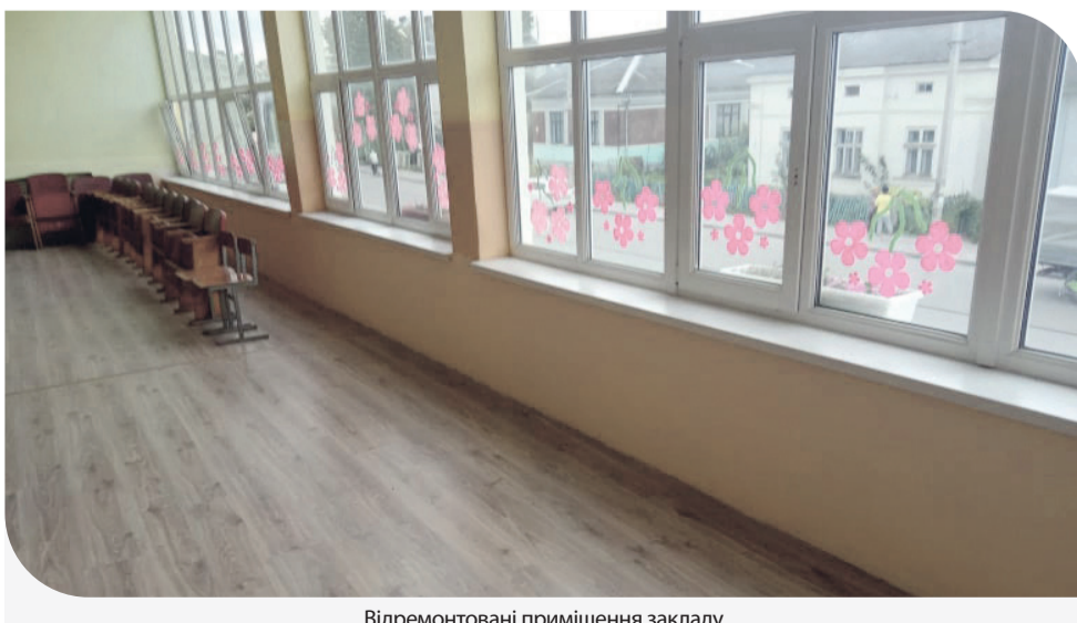
Відремонтовані приміщення закладу

«Ми реалізували чимало проектів у різних сферах, щоб покращити якість життя місцевих жителів. Один з останніх – це проведення ремонтних робіт у будинку культури. Загальна сума допомоги для реалізації цього проекту сягнула 100 тис. грн. До слова, від початку року Компанією інвестовано у розвиток Підволочиського району понад 1,2 млн грн», – зазначив пан Іван.