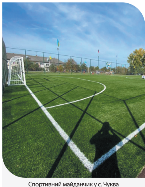
Спортивний майданчик у с. Чуква