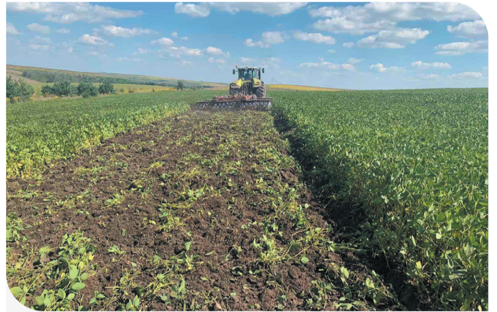
Сидерати на полях Компанії

Вирощування сидератів – рослин, які культивують перед посадкою основної