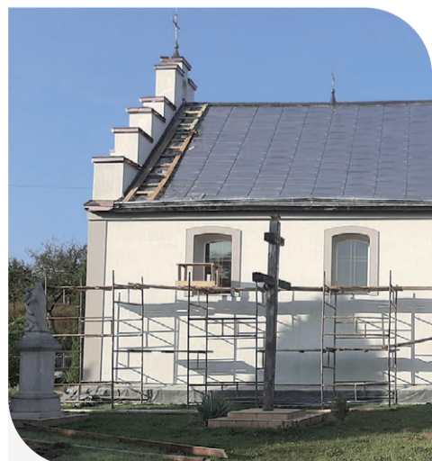
Фасадні роботи довкола церкви у Сухій Долині

«Ми отримали запит на фінансове сприяння у ремонті церкви. Відгукнулись одразу, адже у Компанії розуміють, наскільки важливою є церковна інфраструктура для місцевих жителів, і виділили 12 тис. грн на ремонт фасаду церкви. У цьому році заданий храм не єдиний, який отримав грошову допомогу від «Контінентал»: всього майже 40 тис. грн спрямували на духовність у цій адміністративній раді. За вказані кошти підтримали також церкву у селі Бродки, там вдалось долучитись до перекриття будівлі», – зазначив пан Василь.