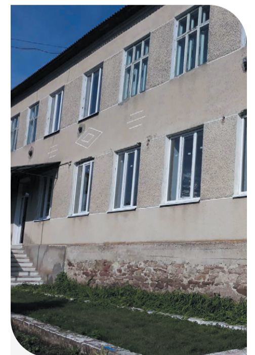
Сучасні металопластикові вікна придбані за сприяння «Контінентал»

«Для нас важливо вирішувати проблеми та реалізовувати проекти, які мають довгострокову користь. У селі соціально важливими є заклади освіти та медицини, тож коли отримали запит – одразу відгукнулись на нього. Всього виділили понад 37 тис. грн на придбання вікон. Для реалізації соціальних проектів Мирненської адміністративної ради торік виділили 46 тис. грн, тож наша співпраця та взаємодія є регулярною і продуктивною», – зазначив пан Ігор .