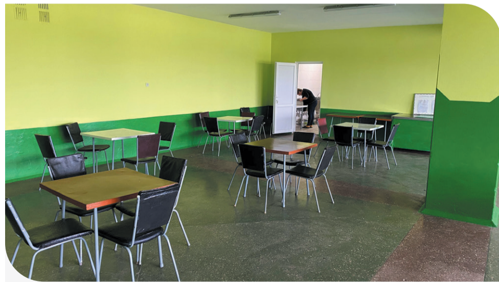
Оновлена шкільна їдальня