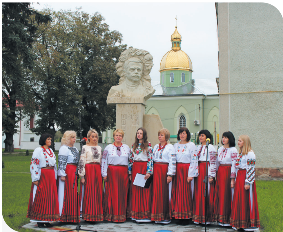
Урочисте святкування на відкритті погруддя

«Після відкриття пам'ятника в місцевому будинку культури провели наукову конференцію. Розповісти про діяльність і досягнення Євгена Олесницького запросили істориків та науковців. Цікавим є той факт, що Євген Олесницький – один із перших організаторів кооперативного руху в Україні. Він відвідував країни Європи, де вивчав економіку та досвід організації кооперативів, щоб зрештою створити такий у Стрию під назвою «Каса Задаткова».