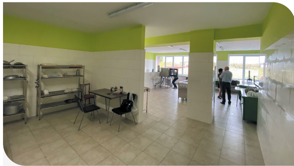
Харчоблок навчального закладу після ремонту