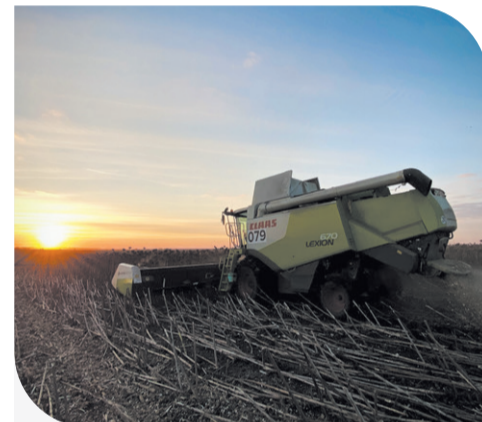
Польові роботи у Компанії "Контінентал".

Нагадаємо, на початку листопада «Контінентал» завершив збір картоплі із загальної площі 1,6 тис. га. Середня валова врожайність культури у Компанії склала 36 т/га, це вище за планові показники. Всього у 2020 році «Контінентал Фармерз Груп» зібрала врожай зернових, бобових і олійних культур із площі 187,7 тис. га.