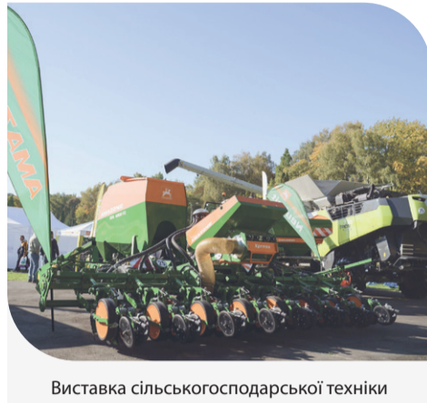
Виставка сільськогосподарської техніки

«Контінентал Фармерз Груп» провела День поля «Як заробити додаткові $100 з гектара: час рахувати». Захід організували спільно з Львівським національним аграрним університетом. Він об'єднав партнерів Компанії, сільськогосподарських виробників, фермерів, представників влади, а також молодь, яка має намір працювати в аграрній сфері. День поля в такому форматі Компанія проводить уже втретє. Для «Контінентал» ця подія — передусім платформа для спілкування та обміну досвідом, а також чудова нагода зміцнити партнерські відносини.