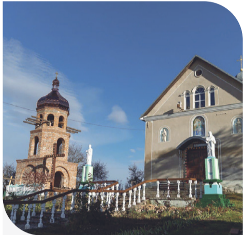
Церква святої Параскеви П'ятниці в селі Білокриниця

Звернулися до «Контінентал» з проханням виділити кошти на церкву святої Параскеви П'ятниці і жителі Підгаєцької ОТГ, що на Тернопільщині. Парафіяни вирішили спорудити біля храму нову дзвіницю, бо стара дерев'яна була вже непридатною до користування.