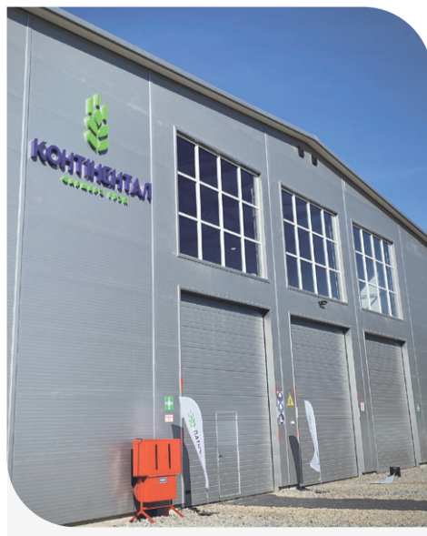
Новозбудоване картоплесховище у с. Чуква

Комплекс оснащений інноваційним вентиляційним обладнанням нідерландської компанії Mooij Agro, завдяки якому можна точно контролювати температуру, вологість та рівні CO 2 у картоплесховищі та формувати індивідуальні параметри під зберігання будь-якого сорту картоплі.