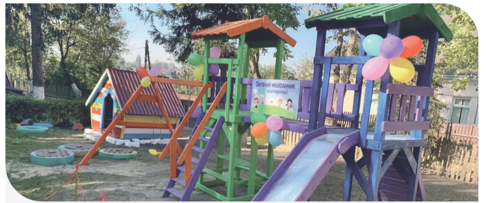
Новий дитячий майданчик у с. Шубранець

Розчулена сприянням агрохолдингу і завідувачка Шубранецького дитячого садка Тетяна Козьменко. За словами керівниці дошкільного закладу, діти вже сподобали об'єкт на дворі. Там багато різних елементів, тож можна і активно погратися, і відпочити на лавочках біля столика.