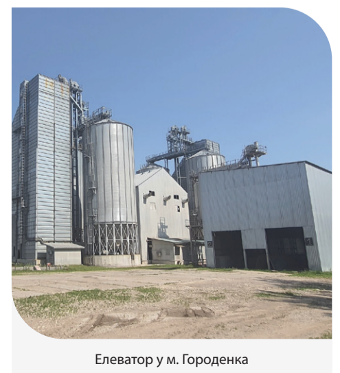
Елеватор у м. Городенка

Довідка: «Контінентал Фармерз Груп» — сільськогосподарська компанія, яка обробляє 195 тис. га землі в 5 областях Західної України: Тернопільській, Львівській, Хмельницькій, Чернівецькій та Івано-Франківській. Компанія спеціалізується на рослинництві: вирощує зернові, олійні та технічні культури, а також є одним з найбільших в Україні виробників картоплі.