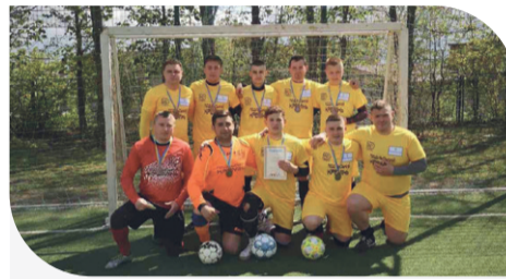
Футбольна команда «Подільський Кремін»