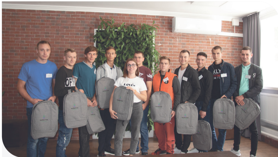
Учасники програми «Майбутнє Контінентал»

В межах програми за кожним стажером закріплені наставники відповідно до спеціальності. В кінці програми всі стажери мають підготувати й захистити дипломні проекти, спрямовані на вдосконалення технологій і виробничих процесів «Контінентал». Автори ідей, які візьмуть до впровадження в Компанії, отримають цінні подарунки.