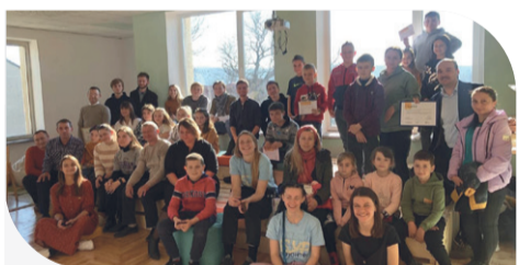
Ініціативна молодь, активні жителі села та волонтери на відкритті центру

Проект втілювали спільно із Заводською територіальною громадою та волонтерами руху «Будуємо Україну разом». Наприкінці жовтня відбулося офіційне відкриття