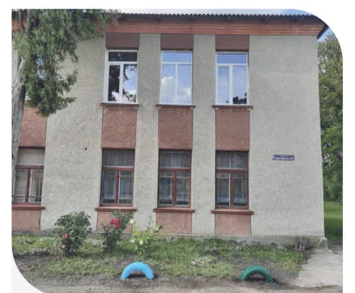
Оновлені вікна в навчальному закладі

«Контінентал Фармерз Груп» давно допомагає нашій громаді і зокрема навчальному закладу. Так, раніше Компанія посприяла із заміною дверей, придбанням віконних жалюзі. За це ми дуже вдячні «Контінентал». Плануємо і надалі співпрацювати з аграріями, спільно оновлюючи нашу школу», — зазначила Галина Павлик.