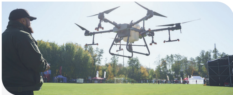
Сільськогосподарський дрон під час демонстраційних польотів