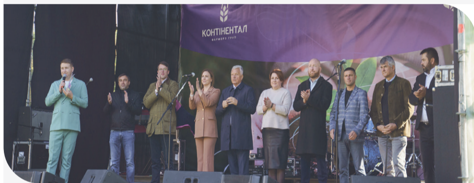
Офіційне відкриття Дня поля

Генеральний директор «Контінентал» Георг фон Нолкен підкреслив, що проведення таких днів поля сприяє не тільки підвищенню професійного рівня фахівців Компанії, але й розвитку сільського господарства в Україні загалом.