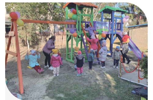
Вихованці навчально-виховного комплексу у с. Задубрівка випробовують нові гірки та гойдалки

Нагадаємо, «Контінентал Фармерз Груп» сприяє у розвитку громадам у всіх регіонах своєї присутності. За кожен гектар землі в обробітку, окрім орендної плати, Компанія спрямовує 130 грн соціальної допомоги. Грошіма селяни розпоряджаються на власний розсуд.