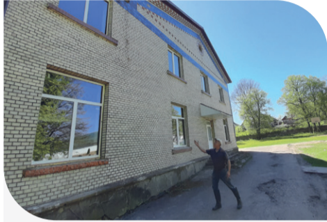
Оновлення у Креміннянському будинку культури