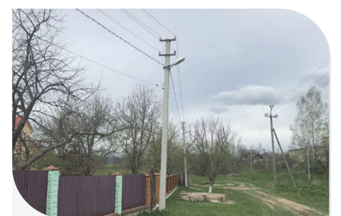
Вуличне освітлення, налагоджене за сприяння Компанії

У Страшевичах задоволені міцним співробітництвом із «Контінентал Фармерз Груп» і сподіваються спільно реалізувати ще багато корисних ініціатив.